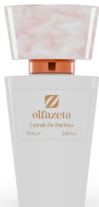
PHOTO DU PRODUIT