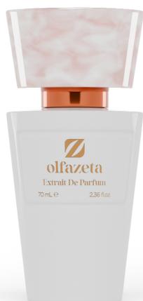
PHOTO DU PRODUIT