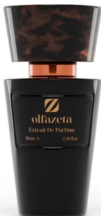
PHOTO DU PRODUIT