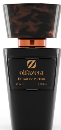
PHOTO DU PRODUIT