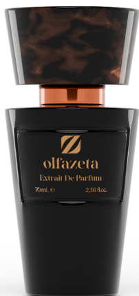
PHOTO DU PRODUIT